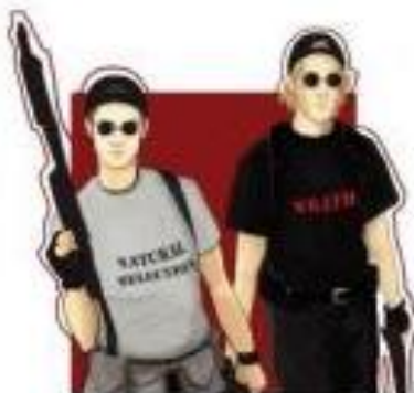
Рисунок 2. Надписи на майках «скулшутеров»

Группами риска вовлечения в экстремистские сообщества в сети Интернет являются молодые люди, ориентированные на общение, самовыражение, не способные противостоять манипулятивному воздействию, психологическому воздействию на значимые для собеседника переживания, связанные с нетерпимостью к какому-то типу людей или роду занятий, к религиозным предпочтениям и т. п.