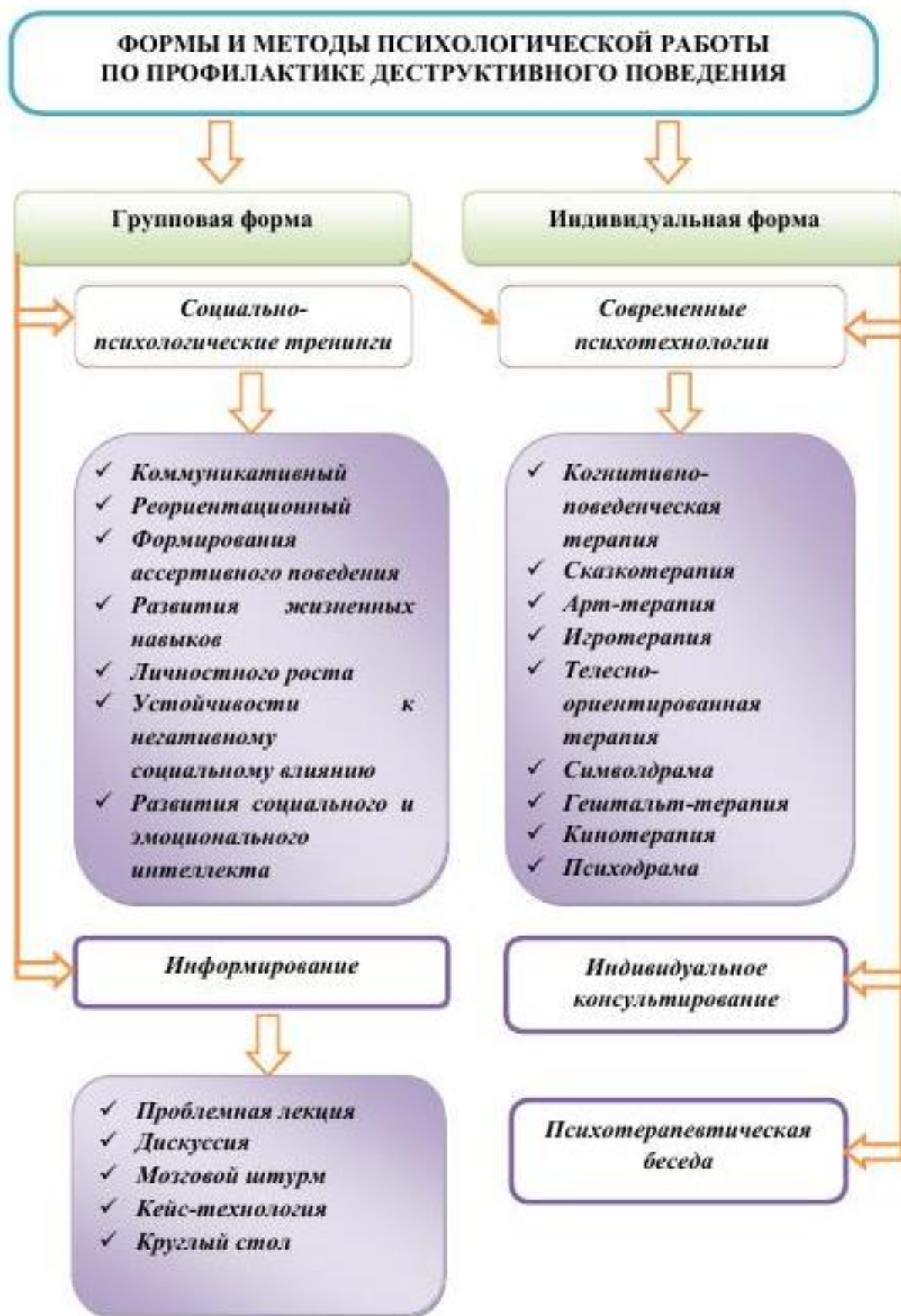
Схема: Формы и методы психологической работы по профилактике деструктивного поведения