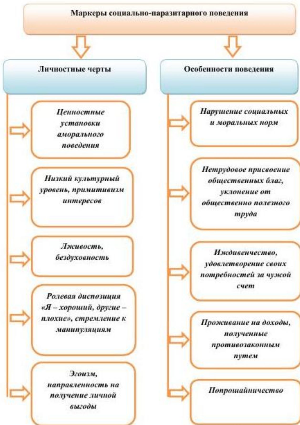
Схема: Маркеры социально – паразитарного поведения