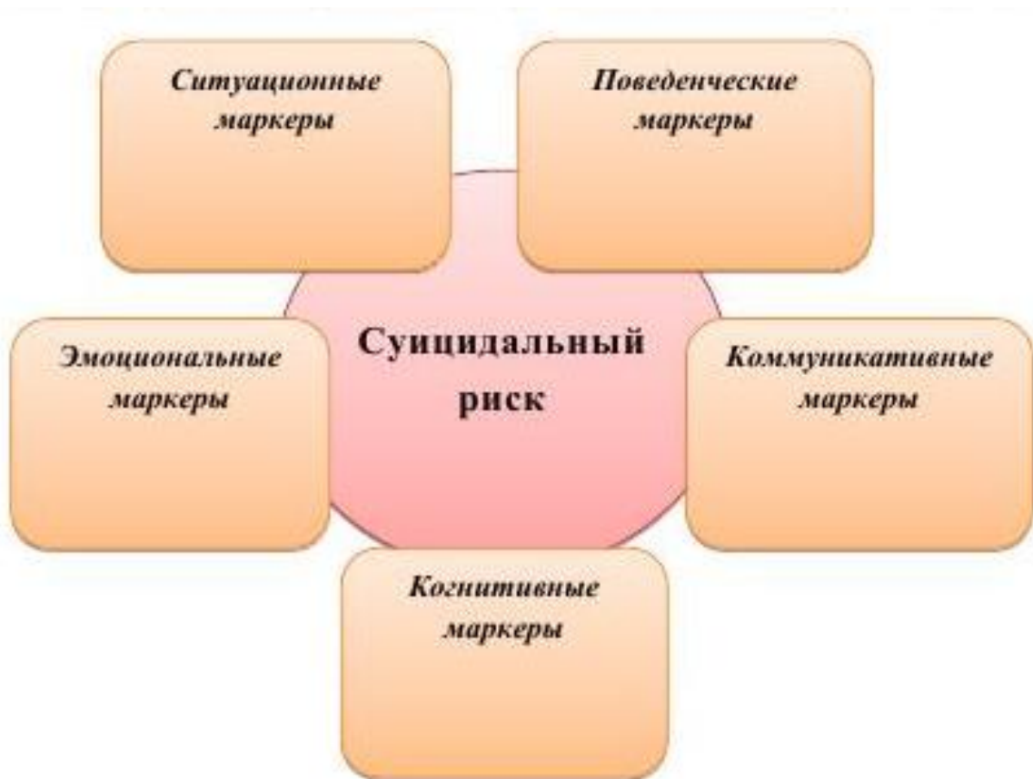
Схема: Маркеры высокого риска истинного суицидального поведения

мысли о самоубийстве («хорошо бы заснуть и не проснуться») или они постоянны, оформилось намерение совершить самоубийство («я сделаю это, другого выхода нет») и появился конкретный план, который включает в себя решение о методе самоубийства, средствах, времени и месте. Чем более обстоятельно разработан суицидальный план, тем выше вероятность его реализации.