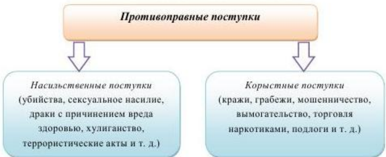
Схема 1.4.1.1. Виды противоправных поступков

Выделяют три типа делинквентного поведения: