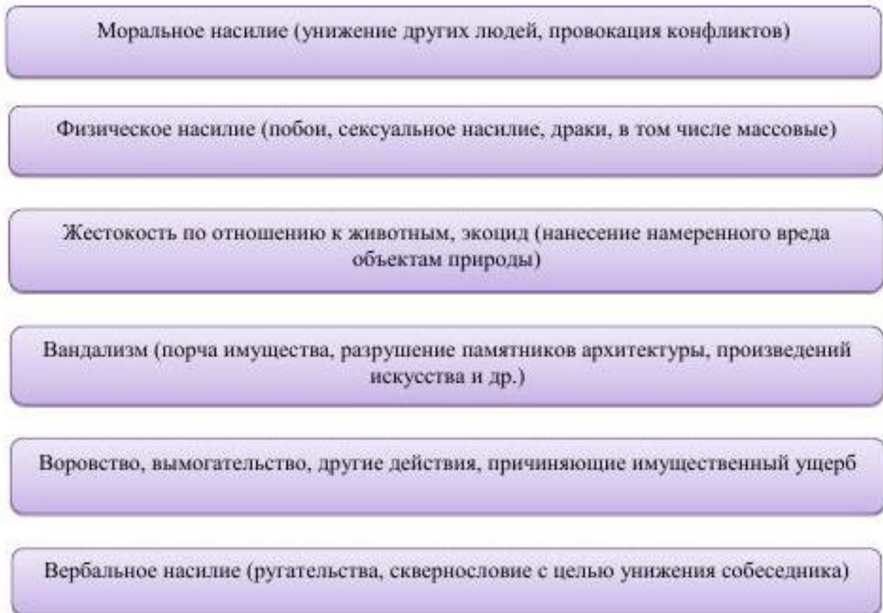
Схема: Маркеры агрессивного поведения