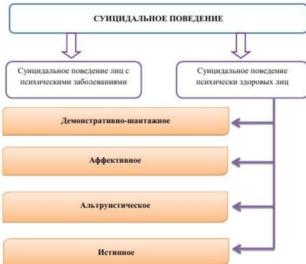
Схема: Виды суицидального поведения

Истинное суицидальное поведение – это уход из жизни под воздействием тяжелых обстоятельств, характеризуется устойчивостью и целенаправленностью действий, связанных с мотивами лишения себя жизни. То есть истинный суицид – это осознанный акт ухода из жизни под воздействием острых психотравмирующих ситуаций, при которых собственная жизнь теряет для человека смысл.