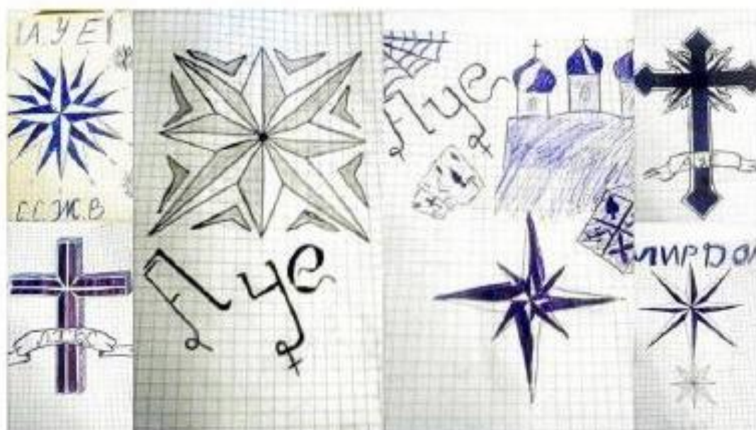
Рисунок 1. Рукописная символика АУЕ

Воровской жаргон, как правило, отражает внутреннюю иерархию преступного мира, закрепляя наиболее обидные и оскорбительные слова, клички и т. д. за теми, кто находится на самой низкой ступени иерархии, а самые «уважительные» слова и выражения – за теми, кто имеет наибольшую власть и влияние. Замена самых обычных слов на жаргонные должна сразу насторожить педагогов и родителей.