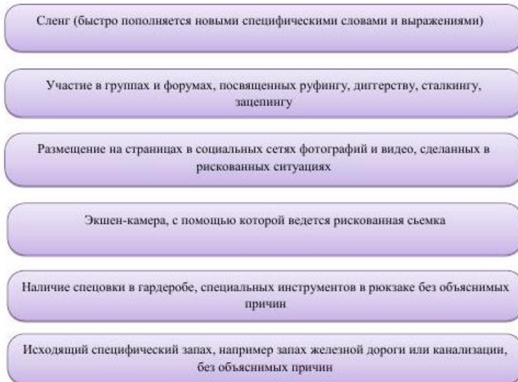
Схема: Маркеры рискованного поведения