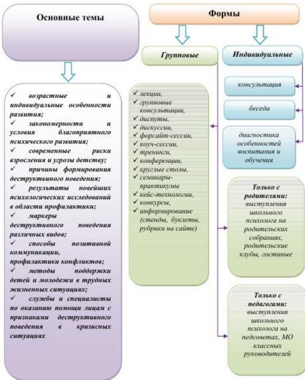
Схема: Тематика и формы повышения психологической компетентности родителей (законных представителей) и педагогов по вопросам профилактики деструктивного поведения обучающихся