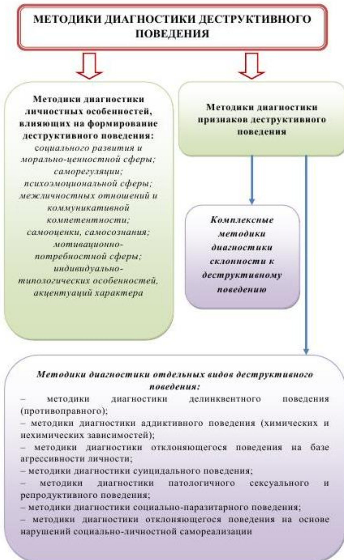
Схема: Методики психологической диагностики девиантного поведения